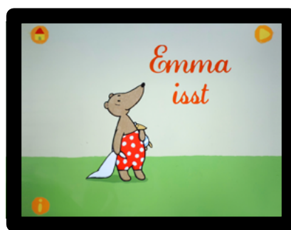
Emma auf Bildschirm